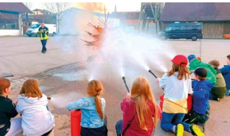
Unsere Jüngsten löschen einen brennenden Christbaum mit Feuerlöschern.

Zu Abschluss durften alle Kinder gemeinsam einen brennenden Christbaum löschen und erlebten wie mit der nötigen Kenntnis und im gemeinsamen Vorgehen unmittelbar ein Löscherfolg erzielt wurde.