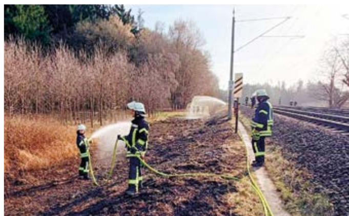
Löscharbeiten entlang der Bahnstrecke am Bahnhof Paindorf

Im Berichtszeitraum dieses Blickpunktes wurden wir zu drei Einsätzen alarmiert. Dies war am 25. Februar eine technische Hilfeleistung am Bahnhof Reichertshausen. Am 7. März nahmen wir aus einem PKW auslaufende Betriebsstoffe am Parkplatz in der Ortsmitte auf und am 10. März löschten wir einen Vegetationsbrand in der Nähe des Bahnhofes Paindorf.