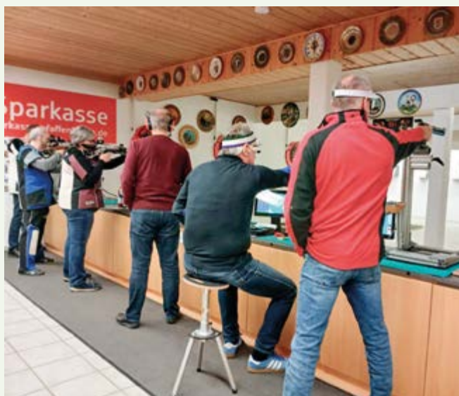
Volle Konzentration am Schießstand mit Luftgewehr oder Luftpistole, freistehend oder aufgelegt.

Alle weiteren Platzierungen können auf der Homepage des Veranstalters eingesehen werden.